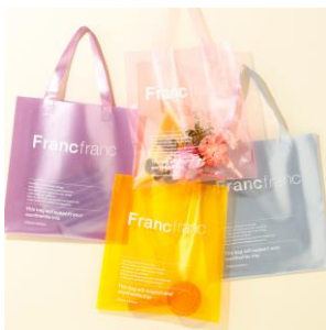
【商品名】クリア トートバッグ 【価格】¥1,000 【種類】8 色展開

今回の POP UP SHOP では「フレ ハンディファン」シリーズのほかにも、これからの季節にぴったりな Francfranc で人気のクリアトートバッグや日傘も販売します。お気に入りのハンディファンとコーディネートして夏のおでかけを快適に楽しくお楽しみください。