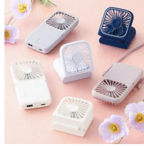
【商品名】フレ スマートハンディファン 【価格】¥2,680～ 【種類】6 色展開

「フレ ハンディファン」シリーズに取り付けることができるネックストラップです。金具を繋げてマルチストラップとしてもお使いいただけます。