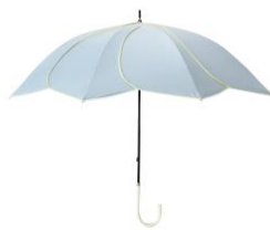
【商品名】バイカラーバイピング 長傘 (晴雨兼用) 【価格】¥2,970 【種類】4 色展開

爽やかなカラーが魅力で、防水仕様なので海やプールなど水場のレジャーに最適なトートバッグです。“中身を見せるバッグ”としてコーディネートを楽しめます。