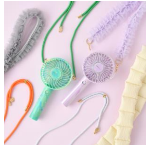
【商品名】フレ ネックストラップ 【価格】¥1,500～ 【種類】9 種類展開

卓上でも携帯型でも使える USB 充電式 2WAY タイプのハンディファンです。風量 5 段階+リズム風の 6 通りの風量が選べます。