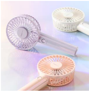
【商品名】フレ ハンディファン 【価格】¥2,680～ 【種類】10 色展開

卓上でも携帯型でも使える USB 充電式 2WAY タイプのハンディファンです。風量 5 段階+リズム風の 6 通りの風量が選べます。