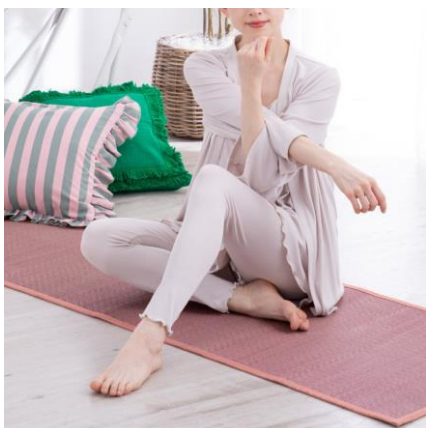
<様々なシーンで使える>

2色のい草を斜めストライプに編み込んだバイカラーのロングゴザマットです。ごろ寝マットやヨガマット、ベッドサイドやキッチンのマットとして様々なシーンでお使いいただけます。収納や移動に便利な持ち運び用のハンドル付きです。裏には滑り止め加工を施しています。