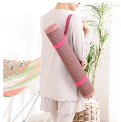
<持ち運びに便利なハンドル付き>