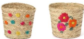
【商品名】シーグラス バスケット 【種類】マルチ/ピンク 【価格】各 ¥2,500

ざっくり編んだデザインが夏らしい印象のバスケットです。スローを入れたり、散らかりがちな小物類をまとめて見せる収納アイテムとしてもおすすめです。