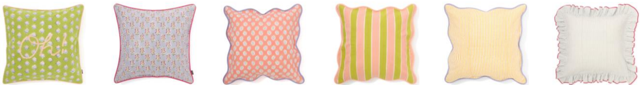
【商品名】ブロックプリント クッションカバー 【種類】グリーン/パープル/ピンク/ピンク×グリーン/イエロー/ライトブルー 【価格】各 ¥3,500

インドの伝統的な染色技法であるブロックプリントのクッションカバーです。機械には生み出せないハンドメイドならではの美しく特別な風合いが楽しめます。