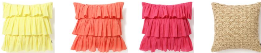
【商品名】リネンフリル クッションカバー 【種類】イエロー/オレンジ/ピンク 【価格】各 ¥4,500 【商品名】ペーパークロシェ クッションカバー ナチュラル 【価格】¥3,500

インドの伝統的な染色技法であるブロックプリントのクッションカバーです。機械には生み出せないハンドメイドならではの美しく特別な風合いが楽しめます。