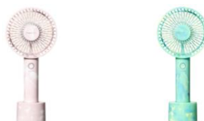
【商品名】フレ ハンディファン マーブル ※抗菌仕様 【種類】ピンク/グリーン 【価格】¥3,280