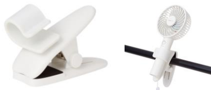
【商品名】フレ ハンディファン クリップ ※抗菌仕様 【価格】¥1,000

フレハンディファン専用の回転スタンドです。90度、180度の2段階から回転を選べます。風に当たり続けることがなく、心地よくお使いいただけます。※USB Type-C のハンディファンに対応しています。充電式ではございません。