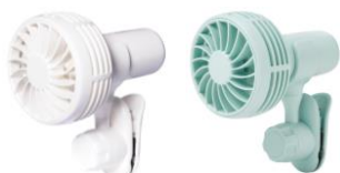
【商品名】フレ ミニファン ※抗菌仕様 【種類】ホワイト/ミント 【価格】¥2,480