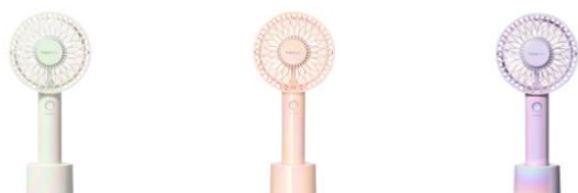
【商品名】フレ ハンディファン オーロラ 【種類】ホワイト/ピンク/パープル 【価格】¥3,980