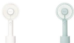
【商品名】フレ ハンディファン ※抗菌仕様 【種類】ホワイト/ミント 【価格】¥2,680

最新トレンドを取り入れたデザインで“きっとお気に入りが見つかる”全 10 色をラインアップ。