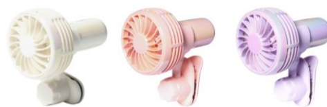
【商品名】フレ ミニファン オーロラ 【種類】ホワイト/ピンク/パープル 【価格】¥2,980

Francfranc 史上最小でパワフルな風量のマルチシーンで使えるミニファンです。付属のクリップで日傘やバックなど、さまざまな場所に取り付けることができます。付属のネックストラップを取り付けるとハンズフリーで使えるのが嬉しいポイントです。重さはたまご 1 個分の最軽量モデルでわずか 60g。ボタン長押しで電源を ON/OFF できる仕様なので、バッグにそのまま入れても誤作動を防ぎ、安全に持ち運ぶことができます。風量は 3 段階調節が可能です。抗菌仕様のカラーは菌の増殖を 99%抑制します。また、2024 年モデルより USB Type-C を採用しています。