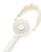
【商品名】フレ ハンドストラップ 【価格】シンプル ホワイト：¥1,300 チュール グレー・ボンディング アイボリー：¥1,800

フレポータブルファンシリーズに取り付けることができるネックストラップとハンドストラップです。金具を繋げてマルチストラップとして、またハンドストラップはバッグストラップとしてもお使いいただけます。高級感のあるデザインがオフィスシーンにおすすめのシンプルタイプ、イベントやお出かけにおすすめのカラフルタイプ、トレンド感がありファッションアイテムとして楽しめるチュール、ボンディングタイプのデザインからシーンに合わせてお選びいただけます。