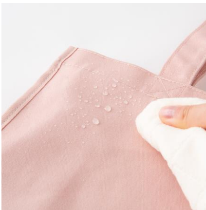
■ 汚れに強いラミネート加工