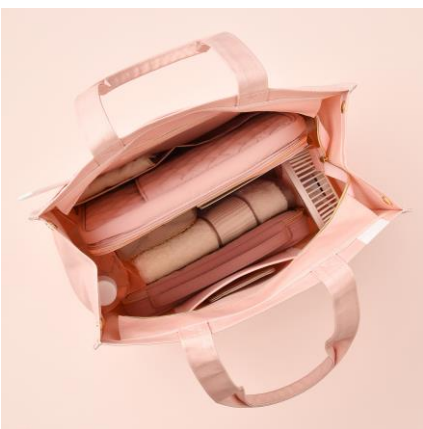
■ 縦長サイズでスッキリ収納