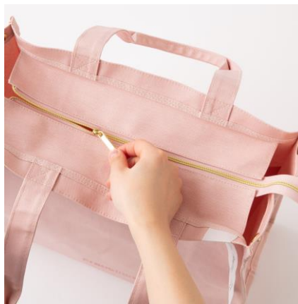
■ 上部チャックが追加