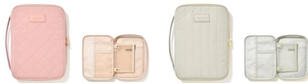
【商品名】キルティング トラベル&タブレットケース 【種類】ピンク／グレー 【価格】各 ¥2,900

広げるとブランケットとしても利用できる便利なネックピローです。ピロー時は高さがしっかりあるため首の安定感が抜群です。移動中もかわいく快適に過ごすことができます。