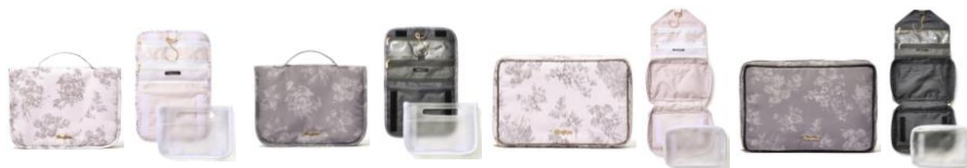
【商品名】クラシックフラワー ハンギングポーチ M・L 【種類】ライトピンク/ダークグレー 【価格】Mサイズ：各 ¥3,500/Lサイズ：各 ¥3,900

ハンガーフックにそのまま吊るして使用できる便利なハンギングポーチです。メッシュのファスナーポケットはコスメや歯ブラシ、ヘアピンなど細々したアイテムの収納にぴったりです。Lサイズは洗面道具だけでなく除菌アイテムやハンカチの替えなども収納できるサイズ感。取り出し可能なクリアポーチはスババッグにもおすすめです。