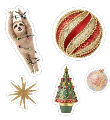
<SNS 投稿キャンペーンでもらえるイベント限定ステッカー>