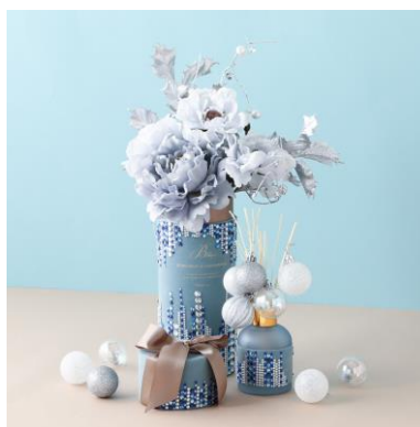
<会場には様々なデコレーションアイデアも登場>