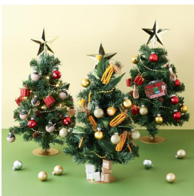
<全国の店舗スタッフが考えたツリーを約100点展示>

※1: Instagram、X (旧 Twitter)、TikTok が対象です。1 アカウントの投稿につき 1 回ガチャガチャが回せます。