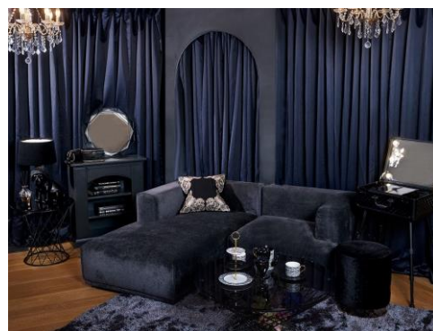
<イメージ：Francfranc 青山店店頭>

実はモダンでシックなアイテムも毎年ラインアップしている Francfranc。その年のトレンドを取り入れながら素材やフォルム、曲線美などのディテール、どんなお部屋にもコーディネートしやすいかなど、“Black”なアイテムにも Francfranc らしさを忘れないこだわりが詰まったアイテムを展開しています。季節が変わるとき、新しく何かに出会ったとき、何ごともない日々の中にほんの少し刺激が欲しいとき、身近なインテリアアイテムを変えるだけでいつもとは少し違う気分を楽しむことができます。是非、店頭でいつもと一味違う“Black”な Francfranc をお楽しみください。