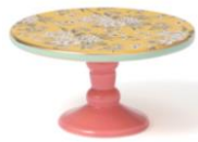
【商品名】シノワズリ スタンド 【種類】イエロー/ピンク 【価格】¥1,200