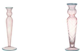
【商品名】ブドワール フラワーベース ピンク S・L