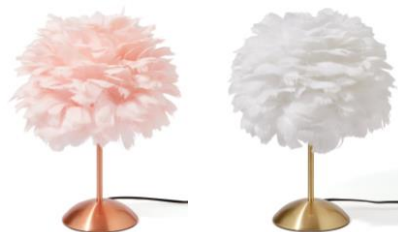
【商品名】フェザーランプ 【種類】ピンク/ホワイト 【価格】¥11,000