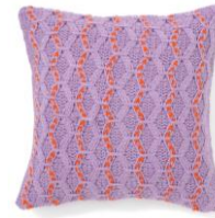
【商品名】ニット-A-066 クッションカバー パープル×オレンジ 【価格】¥4,000