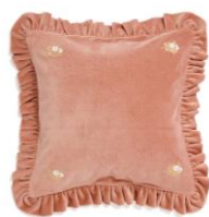
【商品名】ベルベットフリル-A-060 クッ ッションカバー ピンク 【価格】 ¥4,500