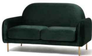
【商品名】エルメ ソファ 2S グリーン×ゴールド 【価格】¥5,4000