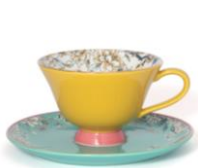
【商品名】シノワズリ カップ&ソーサー 【種類】イエロー/ピンク 【価格】¥1,800