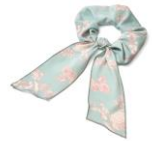
【商品名】フラワーバード リボンシュシュ 【種類】ピンク/グリーン 【価格】 ¥900