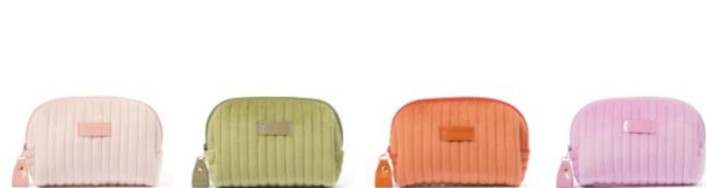
【商品名】ストライプキルト ポーチ S 【種類】ピンク/グリーン/オレンジ/ラベンダー 【価格】¥2,200