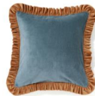
【商品名】ベルベットフリル-C-116 クッションカバー ブルー× ベージュ 【価格】 ¥4,000