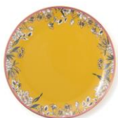
【商品名】シノワズリ プレート 【種類】イエロー/ピンク 【価格】¥1,400