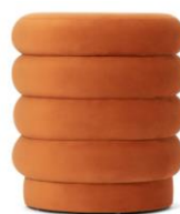
【商品名】ボムリー スツール オレンジ 【価格】¥8,900