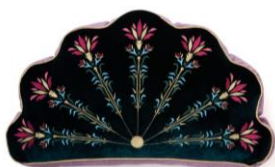
【商品名】ボタニカルピーコック クッショ ン グリーン 【価格】 ¥4,800