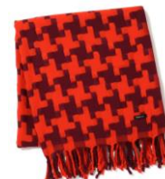
【商品名】チドリスロー 130×170 オレンジ×パープル 【価格】¥5,500