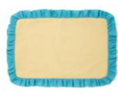
【商品名】バイカラー フリル ランチマット 【種類】イエロー×ブルー/ピンク 【価格】¥1,000