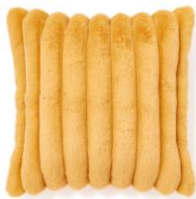
【商品名】ファー-J-043 クッションカバー イエロー 【価格】¥3,000