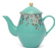
【商品名】シノワズリ ティーポット 【種類】ブルー/ピンク 【価格】¥2,400