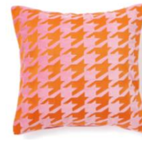
【商品名】EMB チドリ-121 クッションカバー ピンク×オレンジ 【価格】¥4,500