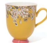
【商品名】シノワズリ マグカップ 【種類】イエロー/ピンク 【価格】¥1,200