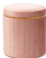
【商品名】マキア スツール ピンク 【価格】 ¥8,900