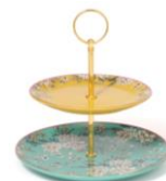
【商品名】シノワズリ スタンド 2段 【種類】イエロー/ピンク 【価格】¥2,200