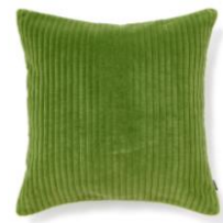
【商品名】ベルベットポンポン-087 クッションカバー パープル×グリーン コーデュロイ-A-089 クッションカバー グリーン 【価格】各¥3,500