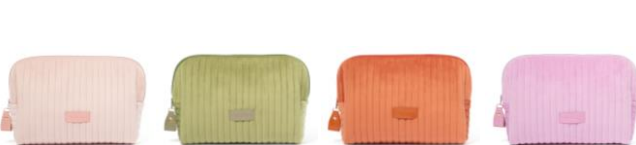
【商品名】ストライプキルト ポーチ L 【種類】ピンク/グリーン/オレンジ/ラベンダー 【価格】¥3,000