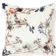
【商品名】ベルベットフラワー-PT-152 ク ッションカバー マルチ 【価格】 ¥3,500