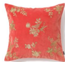
【商品名】EMB バード-093 クッションカ バー オレンジ×ゴールド 【価格】 ¥4,500