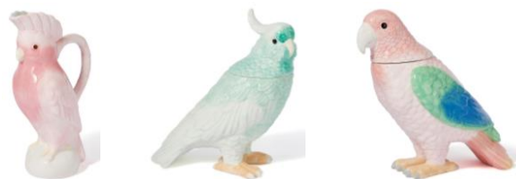
【商品名】バード オブジェ 【種類】ピンク/グリーン/オレンジ 【価格】¥3,500