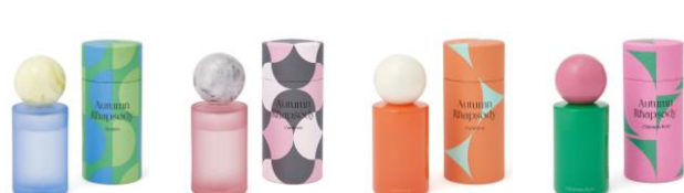
【商品名】オータムラプソディ フレグランススプレー 【種類】ジャスミン/ガーデニア/スノードロップ/クリスマスローズ 【価格】¥2,600