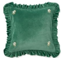
【商品名】ベルベットギャザー-B-069 クッションカバー ダーク ピンク ベルベットフリル-A-065 クッションカバー グリーン 【価格】 各 ¥4,500