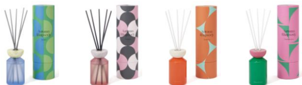
【商品名】オータムラプソディ フレグランスディフューザー 【種類】ジャスミン/ガーデニア/スノードロップ/クリスマスローズ 【価格】¥3,900