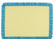
【商品名】バイカラー フリル テーブルクロス 130×180 【種類】イエロー×ブルー/ピンク 【価格】¥4,980