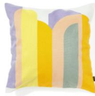
【商品名】EMB キカ-127 クッションカバー マルチ 【価格】¥3,500