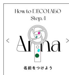
名前をつけてシェア