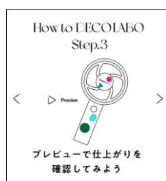
仕上がりを確認する