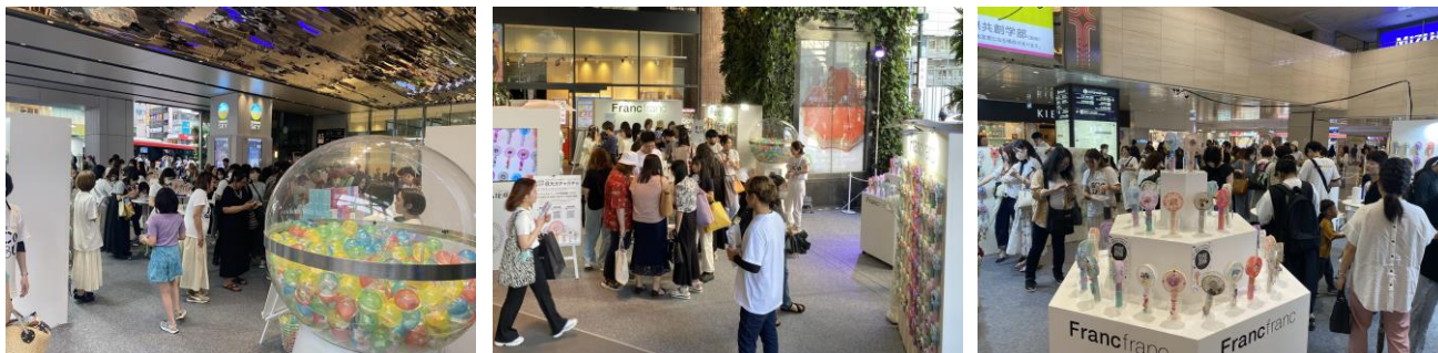
(左)渋谷スクランブルスクエア会場の様子 (中央)渋谷モディ会場の様子 (右)梅田阪急ビッグマン前広場会場の様子

https://www.francfranc.co.jp/uploads/Ff_PressRelease_20230622.pdf