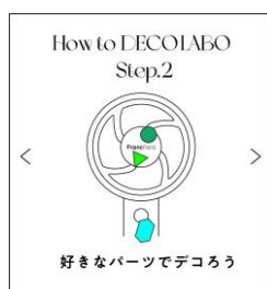
好きなパーツでデコる