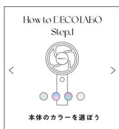
ハンディファンを選ぶ