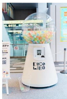
巨大ガチャガチャ

会場の様子を指定ハッシュタグ「#DECOLABO」をつけて SNS 投稿すると回せる巨大ガチャガチャで POP UP イベント限定パーツをゲット、その場でデコレーション体験できるデコブースをご用意しました。ゲットしたパーツでデコレーションするだけで不思議と愛着が湧く、世界にひとつだけのオリジナルハンディファンをお楽しみいただきました。