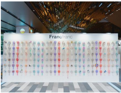
400点以上のデコハンディファン