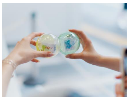
イベント限定パーツ