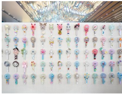
ご当地系デコハンディファン