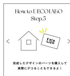
購入して実際にデコる