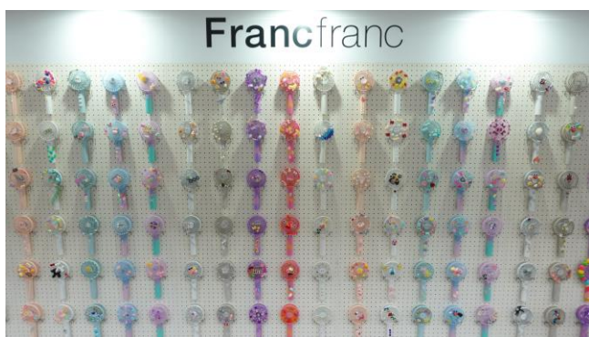
約400点のデコったフレ ハンディファンを展示

会場には約400点のデコった「フレ ハンディファン」が登場！SNS投稿で限定パーツセットをゲットしてその場で簡単にデコレーション体験