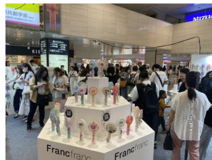
大阪イベントの様子(大阪・梅田)