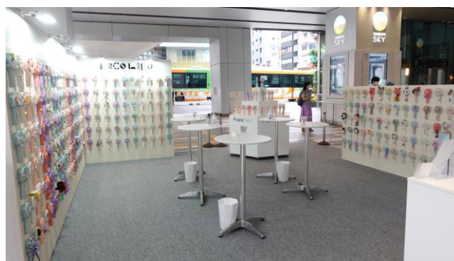
ミニデコブースで簡単にデコレーション体験可能