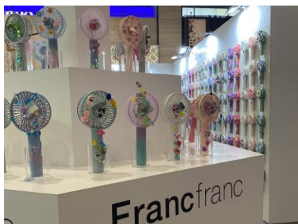
かわいいデコファンをピックアップ