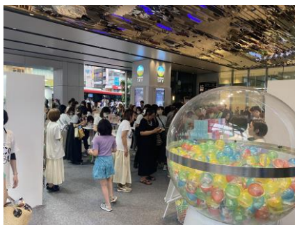
初回イベントの様子(東京・渋谷)