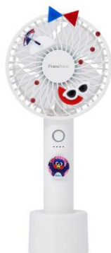
【商品名】 Passion TEAM PEACH モデル B 【価格】 ¥ 3,500