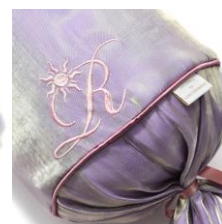
【商品名】ラプンツェル/クッション 【価格】 ¥5,000

ラプンツェルをイメージしたボルスター型のクッションです。ラプンツェルの衣装をモチーフに、レースアップや刺繍を施したこだわりのデザインです。シンプルな円柱型は抱き心地もよく、ソファやベッドのアクセントに最適です。