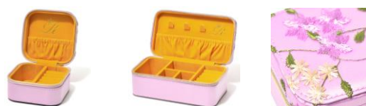
【商品名】ラプンツェル/トラベルジュエリーボックス S ラプンツェル/トラベルジュエリーボックス M 【価格】 Sサイズ： ¥2,800/Mサイズ： ¥4,800