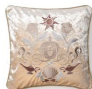
【商品名】刺繍 クッションカバー 【価格】 ¥5,000

5人のプリンセスモチーフを集合させたオリジナルの総柄をプリントしたクッションカバーです。厚みのあるフリンジが豪華で高級感あるデザインです。お部屋のアクセントになる存在感あるアイテムです。