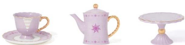
【商品名・価格】ラプンツェル/カップ&ソーサー： ¥3,000 ラプンツェル/ティーポット： ¥4,000 ラプンツェル/スタンド： ¥1,800

ラプンツェルをイメージしたボルスター型のクッションです。ラプンツェルの衣装をモチーフに、レースアップや刺繍を施したこだわりのデザインです。シンプルな円柱型は抱き心地もよく、ソファやベッドのアクセントに最適です。