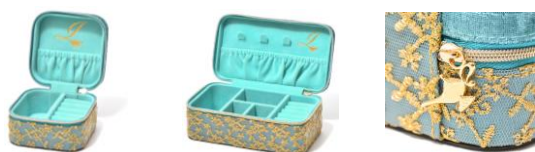
【商品名】 ジャスミン/トラベルジュエリーボックス S ジャスミン/トラベルジュエリーボックス M 【価格】 Sサイズ： ¥2,800/Mサイズ： ¥4,800

日常にさりげなくプリンセスを取り入れられるデザインに仕上げたティーウェアシリーズです。カップとティーポットの持ち手はアプーの尻尾をイメージした形状になっており、本体には魔法のランプのデザインを施しました。とても繊細で可愛いデザインが魅力です。