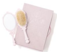
【商品名】ミラー&ヘアブラシセット 【価格】 ¥6,800 ※9月中旬入荷予定

5人のプリンセスモチーフを集合させたオリジナルエンブレムを刺繍したクッションカバーです。光沢のある生地にゴールドトーンの刺繍を施し、周囲をロープで囲んだクラシカルで上品なデザインです。落ち着いた雰囲気インテリアに取り入れやすいアイテムです。