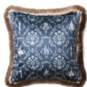
【商品名】フリンジ クッションカバー 【価格】 ¥5,000