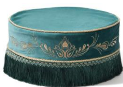
【商品名】 ジャスミン/フロア クッション 【価格】 ¥6,800