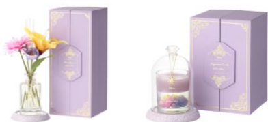
【商品名・価格】ラプンツェル/ルームフレグランス： ¥5,900 ラプンツェル/キャンドル： ¥4,500