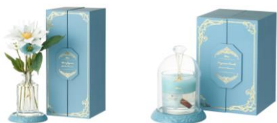
【商品名・価格】 ジャスミン/ルームフレグランス： ¥5,900 ジャスミン/キャンドル： ¥4,500