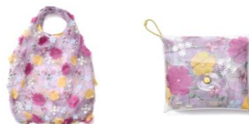
【商品名】ラプンツェル/チュールバッグ 【価格】 ¥2,900