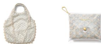
【商品名】 ジャスミン/チュールバッグ 【価格】 ¥2,900