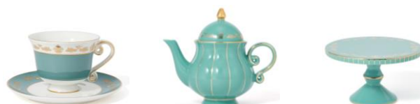
【商品名・価格】 ジャスミン/カップ&ソーサー： ¥3,000 ジャスミン/ティーポット： ¥4,000 ジャスミン/スタンド： ¥1,800

日常にさりげなくプリンセスを取り入れられるデザインに仕上げたティーウェアシリーズです。カップとティーポットの持ち手はアプーの尻尾をイメージした形状になっており、本体には魔法のランプのデザインを施しました。とても繊細で可愛いデザインが魅力です。