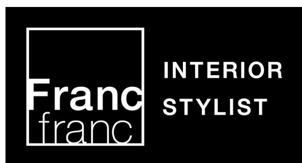
Francfranc Interior Stylist 認定ロゴマーク

『FIS』は、Francfrancの商品特徴である多彩なデザインを生かしたコーディネート提案力を向上し、家具・インテリアファブリックの販売を強化することを目的に、2018年4月に導入した制度です。第1期となる2018年には12名を『FIS』に認定、第2期の2019年には11名を、第3期の2020年には10名を、そして第4期となる2021年4月に新たに10名が『FIS』に認定されました。家具は、暮らしの中で長く付き合っていくものであり、知識や判断材料がなくては購入しにくいものです。お客様の悩みや不明点を気軽にご相談いただき、インテリアのプロならではの適切な提案で、インテリアを選ぶ楽しさやコーディネートの面白さを感じていただきたいと考えます。