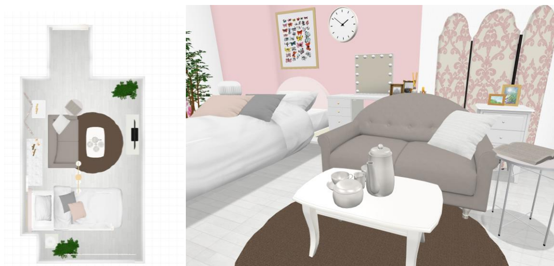
オンラインインテリア相談 画面イメージ（1Kの場合）

オンライン接客サービス予約ページ： https://francfranc.com/blogs/feature/online_interior_consultation